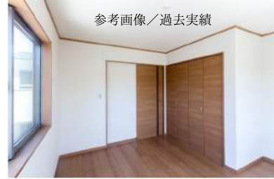
参考画像／過去実績