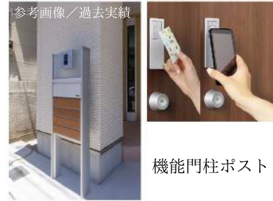
参考画像／過去実績