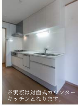
※実際は対面式カウンターキッチンとなります。