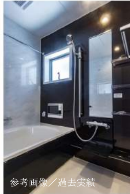
参考画像／過去実績