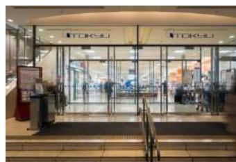
日吉東急アベニュー 約 1800m