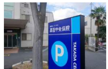
高田中央病院 約 1000m