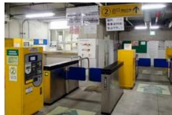
日吉駅東口自転車駐車場