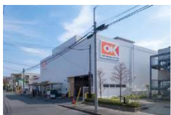
オーケストア 日吉店 約 1400m