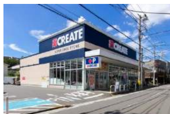
クリエイト港北下田店 約 650m