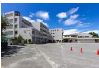
横浜市立日吉台西中学校 約 700m