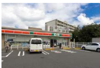
サンクス横浜下田町5丁目店 約 180m