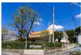
プリンセス幼稚園 約 600m