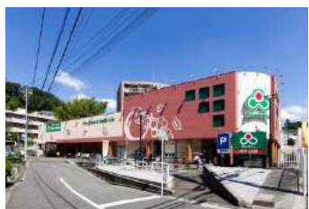
スーパーマーケット三徳高田店 約 750m