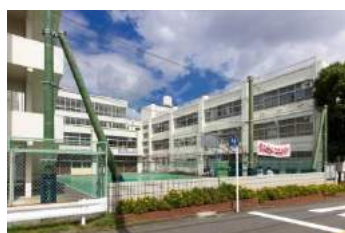
横浜市立下田小学校 約 300m