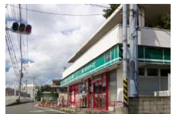
まいばすけっと下田町6丁目店 約 450m