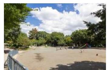
下田町四丁目公園 約 500m

※距離表示については地図上の外側距離を、徒歩分数表示については80mを1分として算出し、端数を切り上げたものです。