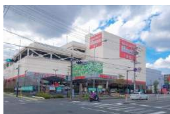
島忠ホームズ港北高田店 約 1400m